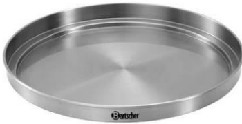
Warmhoudeksel voor kopjes (is niet in de levering inbegrepen ) geschikt voor ca. 10 - 15 kopjes Materiaal: roestvrij staal Ø 400 mm, Randhoogte: 39 mm Gewicht: 0,76 kg Art.-Nr.: 200059