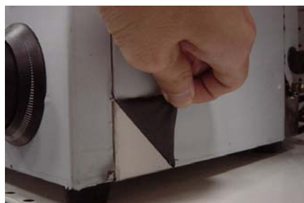
Figuur 2: Het verwijderen van de folie