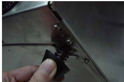
Figuur 1: Het monteren van de pootjes