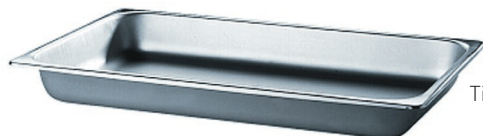
Tigaie pentru mâncare