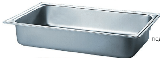
поддон для воды