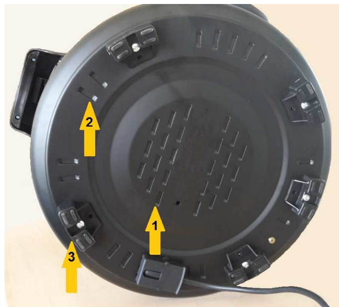
Onderzijde met ventilatiegaten (1, 2) en voetstukjes (3)