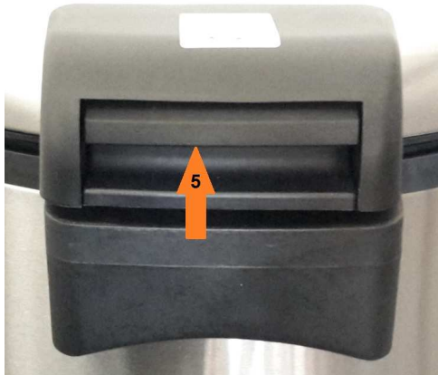
Ontgrendeling (5) met handvat