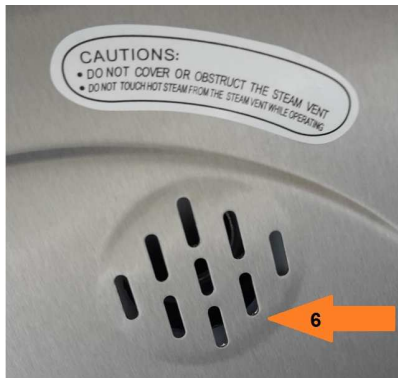
Stoomuitlaat (6) aan de bovenkant (op het deksel)