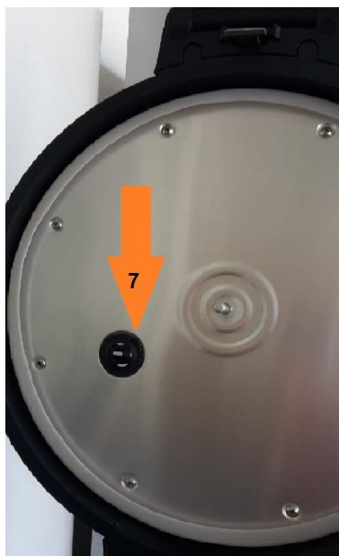
Stoomuitlaat (7) onderaan het deksel na verwijderen van de binnenste dekselplaat