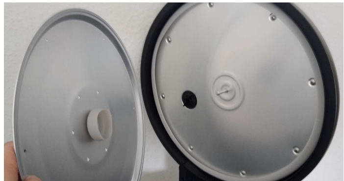
Binnenkant van het deksel: de binnenste deselkplaat is geïnstalleerd. Deze voor de reiniging verwijderen!